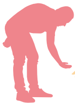
フレンチブルドック (2歳)

嫌がることなく、むしろ食いつきが良かったので、匂いも良く、おやつ感覚で食べてくれたので良かったです。いつもはごはんには混ぜても薬で引けました。